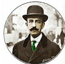
MANUEL DE FALLA.

Manuel de Falla : nuits dans les jardins d'Espagne, chansons populaires, concerto pour clavecin Joaquin Rodrigo : concerto d'Aranjuez pour guitare et orchestre